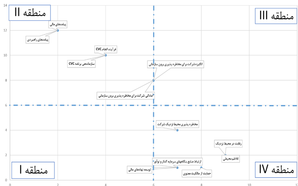
شکل ۲- ماتریس قدرت هدایت- وابستگی

حاصل از این مصاحبه‌ها که به صورت عمیق نیمه ساختار یافته انجام شدند با استفاده از روش تحلیل محتوا مورد بررسی قرار گرفت و مفاهیم مرتبط با مسئله تحقیق استخراج گردید. سپس محقق با مطالعه ادبیات نسبت به شناسایی عوامل موثر بر به کارگیری سرمایه‌گذاری مخاطره‌آمیز شرکتی در متون مقالات مندرج در مجله‌های معتبر از دهه ۱۹۸۰ تا کنون اقدام نمود. مجموعه مفاهیم بدست آمده از این دوگام در اختیار خبرگان قرار داده شد و با مشورت ایشان مفاهیم منتخب در دوازده مقوله طبقه بندی گردید. در مرحله بعد به منظور برقراری ارتباط بین مقوله‌ها و ارائه مدل ساختاری آنها از روش مدل‌سازی ساختاری تفسیری بهره گرفته شد. نتایج تحقیق نشان می‌دهد که دو مقوله تلاطم محیطی و فشار رقابتی علت اصلی به کارگیری سرمایه‌گذاری مخاطره‌آمیز شرکتی در صنعت هستند؛ تلاطم بیشتر به معنای تجربه تغییرات سریع در تکنولوژی، دوره عمر کوتاه محصولات و فرصت اندک برای حضور در بازار است که خود با ایجاد فضای رقابتی بیشتر در ارتباط است. در فضایی که میزان تغییرات زیاد و رقابت سنگین است شرکت‌های کوچک نوآور ظهور می‌کنند و به صورت یک گزینه در کنار سرمایه‌گذاری روی تحقیق و توسعه داخل سازمان قرار می‌گیرند. در صورتی که حمایت از مالکیت معنوی قوی باشد بهره‌برداری از نوآوری این شرکت‌ها در قالب سرمایه‌گذاری‌های مخاطره‌پذیر شرکتی صورت می‌پذیرد؛ بدین ترتیب مخاطره‌پذیری محیط نیز افزایش می‌یابد.